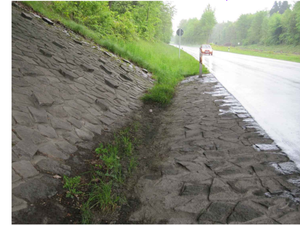
Abb. 4: Unter Brückenbauwerk - nördliche Fahrbahnseite