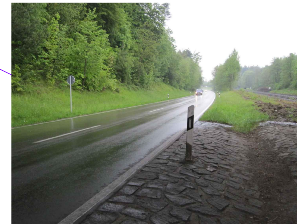
Abb. 5: Unter Brückenbauwerk - südliche Fahrbahnseite